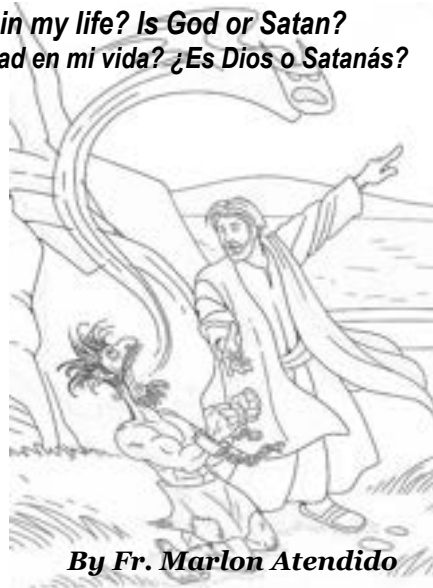
By Fr. Marlon Atendido

In the gospel today a man with an unclean spirit or in a literal sense a man possessed with demons had made a very daring confession: "I know who you are – the Holy One of God! Jesus rebuked him and said "Quiet! Come out of him!" Jesus set the man free, in just five words the demons left immediately! The demons obeyed Jesus because he spoke with authority. But interestingly we find this man with unclean spirit inside the synagogue. Therefore, if demons can quote scriptures, they can also be present inside our Churches today. Then, it is fitting for us to ask who has an authority over our life? Of course, most of us will assert it is God! But don't we realize that every time we give in to our temptations, we fall into our favorite sins, we allow the evil one to rule over us. Let us remember that one of the greatest exorcisms we can do to ourselves is to approach the Sacrament of Confession. As John Bergsma wrote: "The