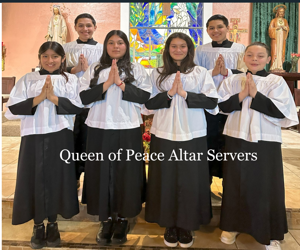
Queen of Peace Altar Servers